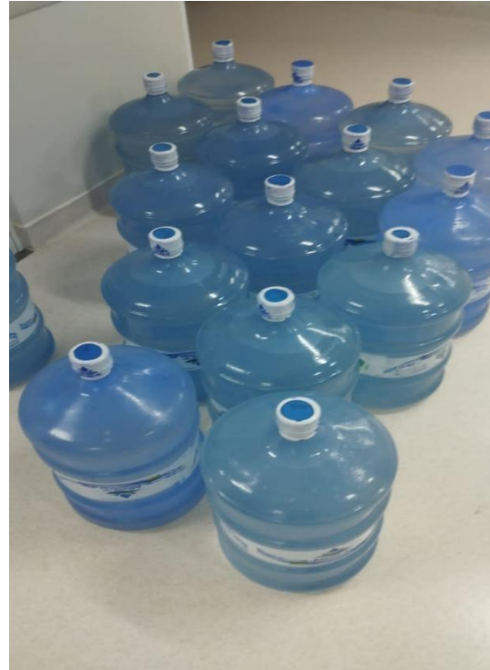
Figura 6: Abastecimento de água mineral.