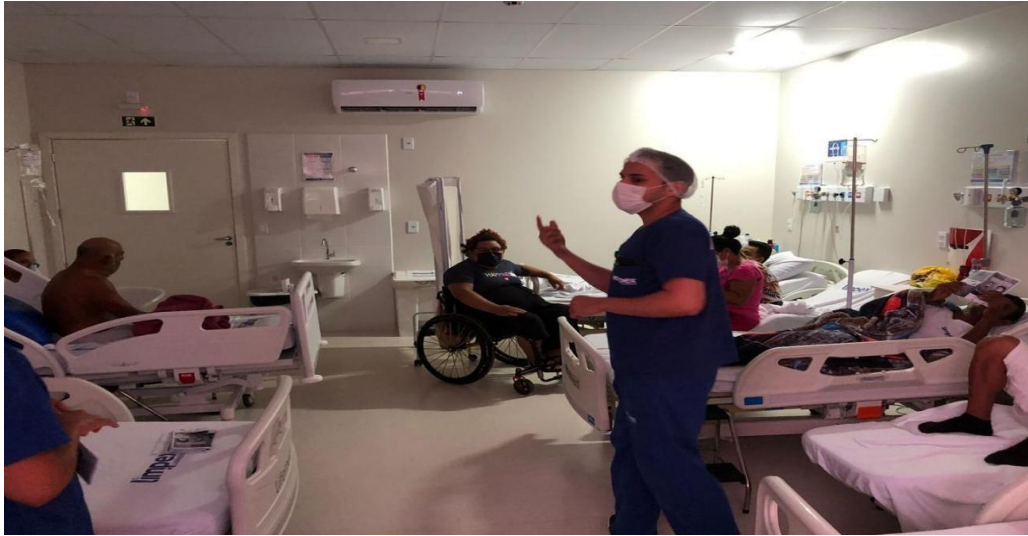
Figura 3: Palestra em alusão ao dia nacional de combate à tuberculose.