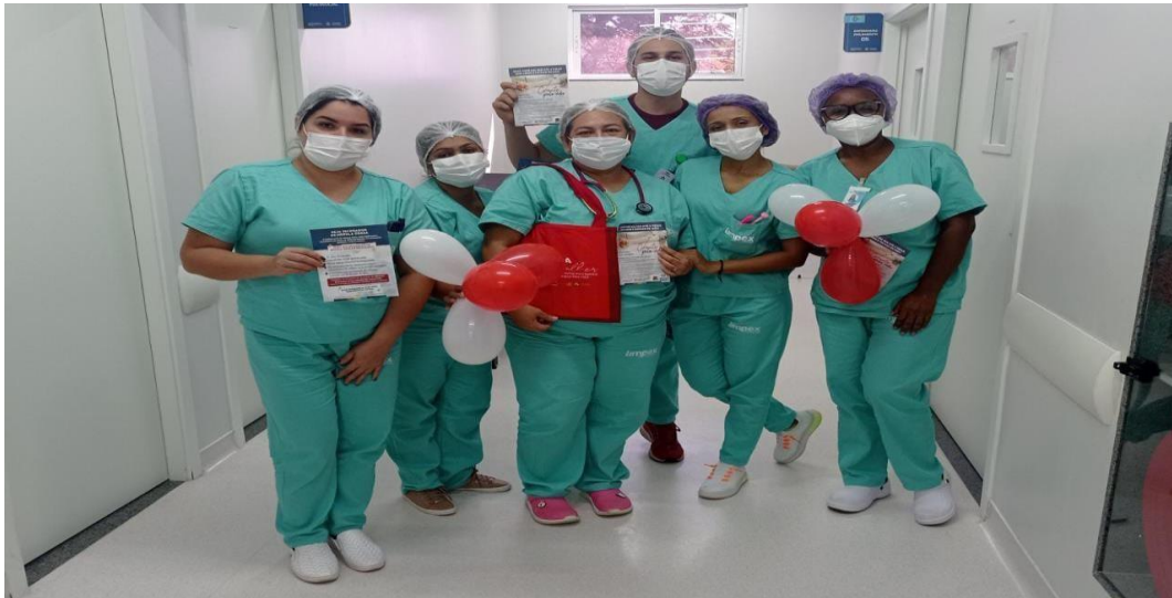
Figura 4: Blitz educativa sobre a importância do doador de sangue.