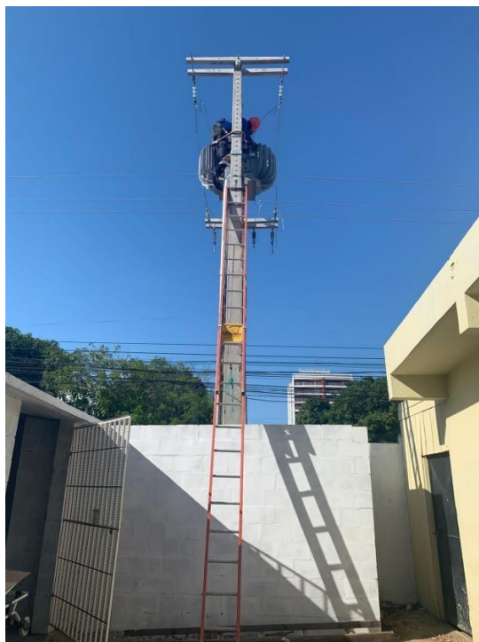
Figura 2: Conserto do transformador.