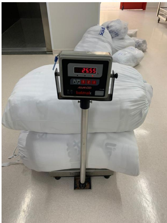
Figura 1: Pesagem de roupa limpa.