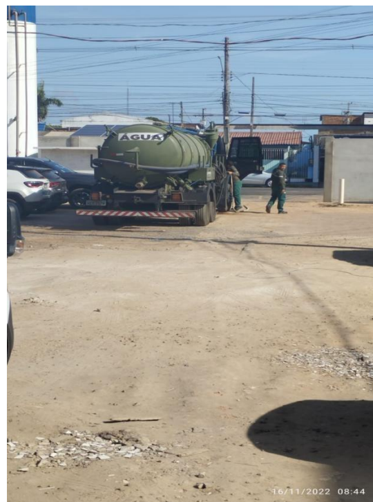
Figura 4: Abastecimento de água.