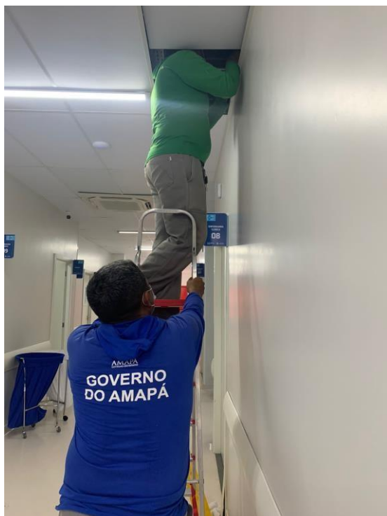
Figura 3: Manutenção da rede elétrica.