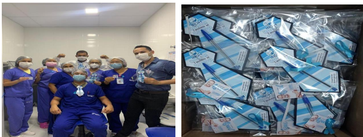
Figura 1 e 2: Ação em alusão ao novembro azul

Sendo assim, seguem algumas das ações realizadas na Unidade durante o referido mês: