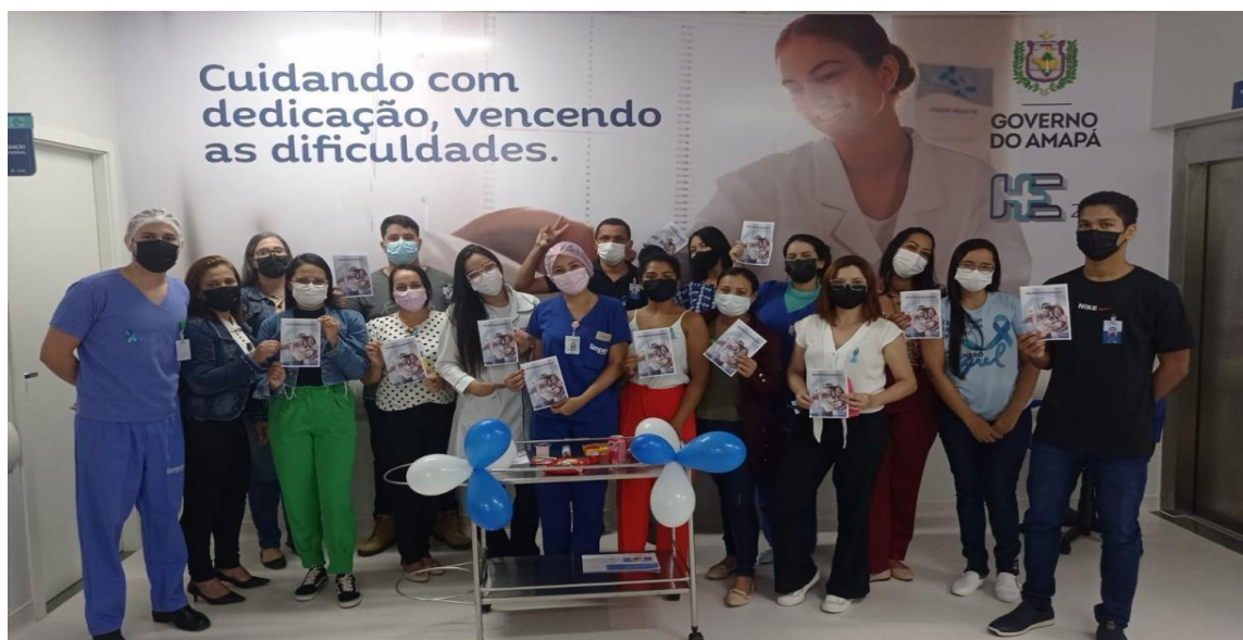
Figura 2: Palestra em alusão ao dia mundial da diabetes