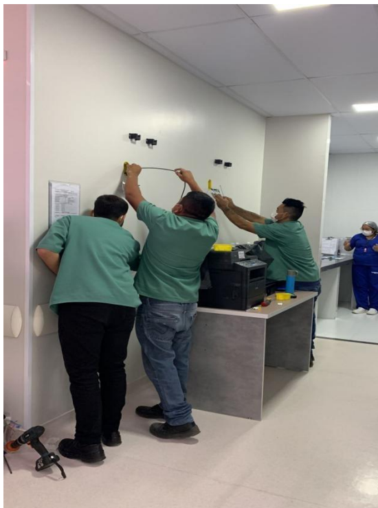
Figura 7: Instalação de televisores.